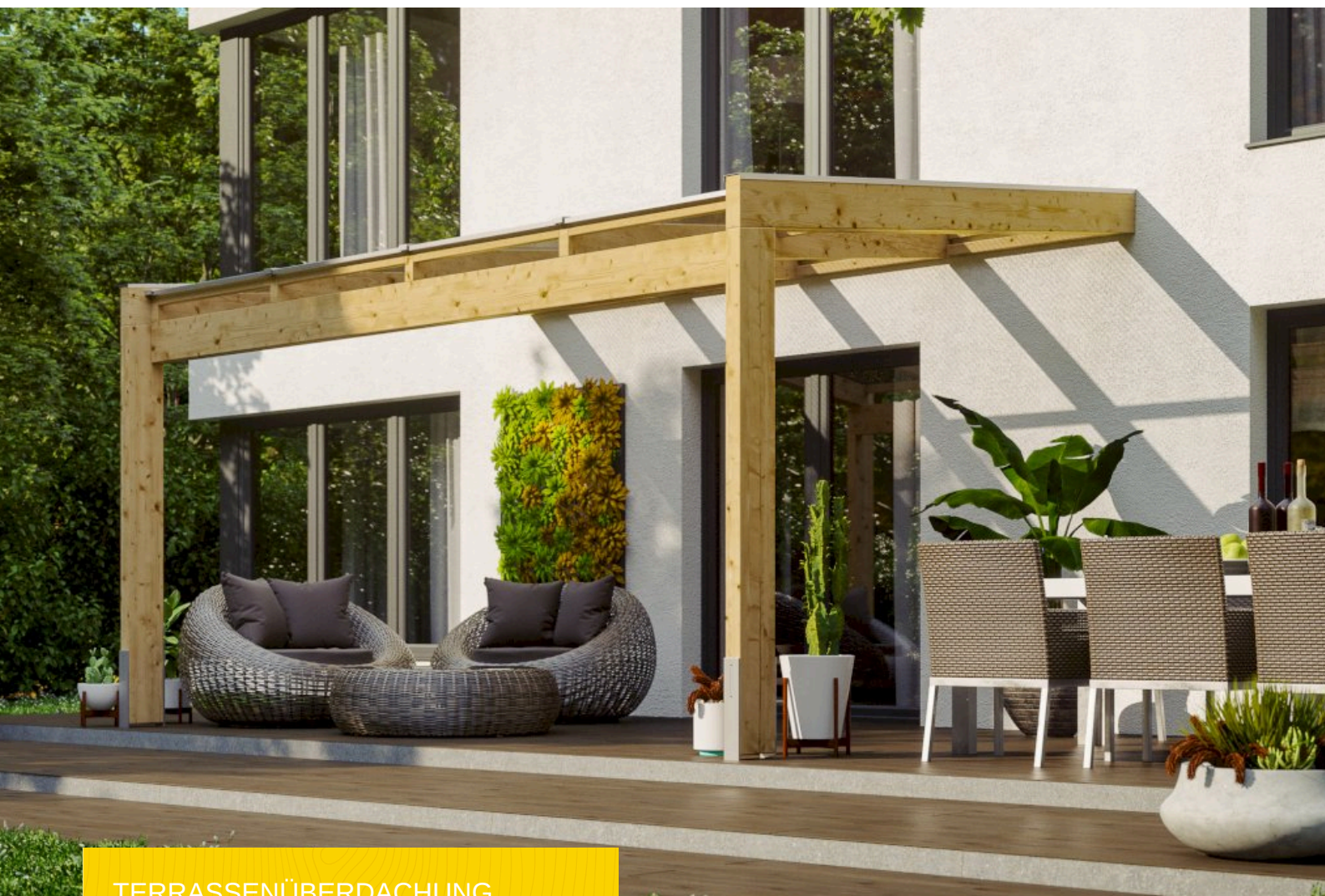
TERRASSENÜBERDACHUNG NOVARA 450 x 359 cm

Massive Konstruktion aus hochwertigem Leimholz (BSH-Fichte)